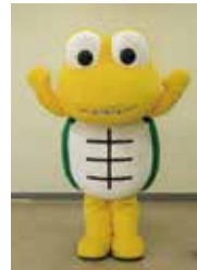
吹上浜砂の祭典マスコットキャラクター サンディーくん

南さつま市は、安心・安全な住みよいまちだから、健康元気都市だから、A K B(あかるく・かわいい・ばあちゃん)がたくさんいます! A K J(あかるく・かっこいい・じいちゃん)がとっても元気です! 公共交通機関がバスしかないため、バスの運行時刻以外に移動される際には、自家用車が必須となります。また、移住をし、定住するためには、地域の行事への参加など、地域の方々とのお付き合いが重要となります。