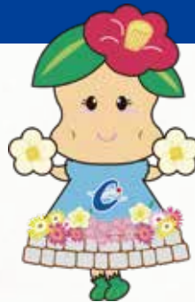
夢追い長島花フェスタキャラクター はなちゃん

陽光きらめく青い海原と広大に広がる段々畑、遠くには天草の島々が望める風光明媚な長島です。