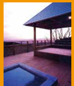
霧島市内には、良質な温泉がたくさんあります。

空港からのアクセスが抜群で、水と空気がおいしく温泉も豊富という恵まれた環境。霧島山の大自然は四季折々の風景が楽しみ、トレッキングには最高です。菜園畑を作ったり、川や海の釣りにも行けて、車さえあれば買い物も便利。ちょっと贅沢な田舎暮らしを味わえます。