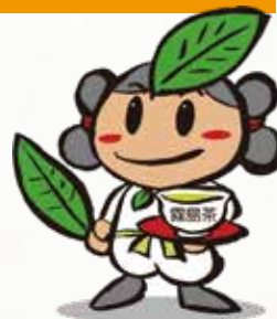
霧島茶キャラクター 茶ノミコトくん

最短で東京から100分、大阪からは70分。都会から遠いようで近い。また、日本初の国立公園である霧島山は、平成22年9月に日本ジオパークに認定されました。雄大な自然、歴史と伝統、豊富な温泉。ふれてみませんか!?「霧島の魅力」に…。