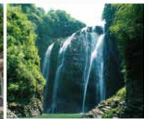
日本の滝百選にも選ばれている「龍門滝」があります。