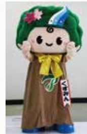
始良市イメージキャラクター くすみん

快適に住みよいまちづくりのために「自治会」への加入をお願いします。自治会では、地域の美化活動、自主防災活動、親睦を深めるお祭りや運動会、ごみステーションや防犯灯の管理等の活動を行っています。