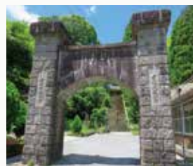
「山田の凱旋門」は、国内で唯一現存する石造りの凱旋門です。

市内の中山間地区に住宅取得をされた方への補助金制度があります。住宅増改築補助金・子ども補助金・引越費用補助金の加算補助金もあります。(ふるさと移住・定住促進事業)