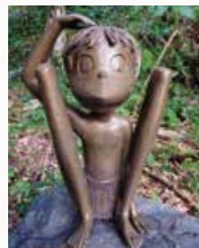
奄美の妖怪 ケンムン

各集落は少子高齢化が進んでいるため、子どもから高齢者まで協力し合って地元行事に参加しています。公共交通機関はバスのみで、奄美市に向かう際は1日3便しかないので、自家用車が必要です。移住を考えている方は、一度足を運んでいただければ、案内などお手伝いをさせていただきます。