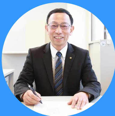
インキュベーションマネージャー (鹿児島相互信用金庫職員)

もちろん、 専任の移住支援コーディネーターが 鹿児島市での暮らしの魅力も たっぷりご紹介します！