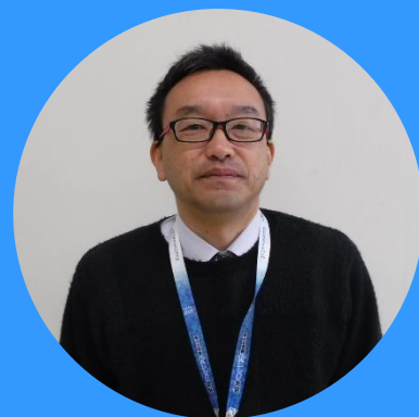
農業技師 (吉田農林事務所長)