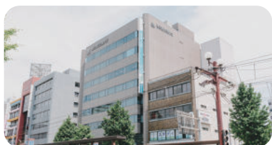
●都会に身をおかず、住みやすい街から都心部の仕事に関わることができます。

次に、鹿児島は都心と比べて自然が豊かであるという声が多くあがりました。気持ちをリフレッシュするために自然を感じることは、ひとつの有効な手段であるといえます。気軽に行くことができる場所で自然を感じられることが、地方ならではのメリットだそうです。